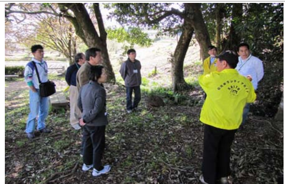
観光ガイドの様子