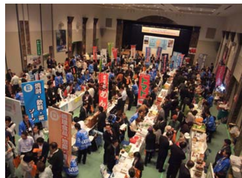
大隅の『食』の展示、PR、個別商談等 (アグリマッチングフェア)