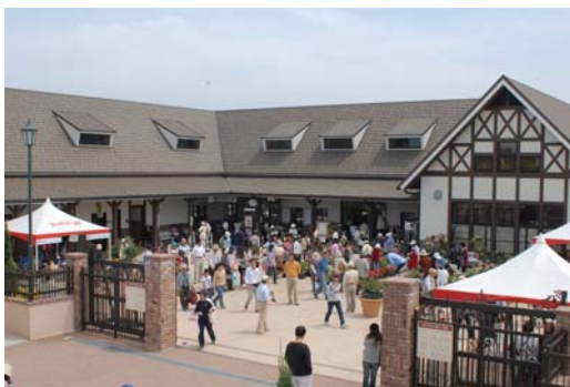
かのやばら園（ばらの館）