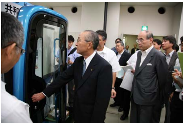
①技術提案型展示商談会