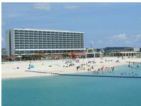
平成21年5月にオープンしたリゾートホテル