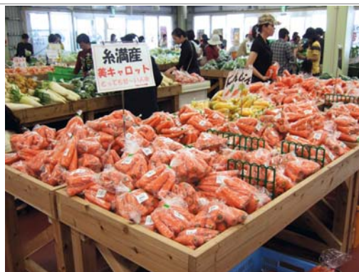
糸満産農産物が並ぶJAファーマーズマーケット