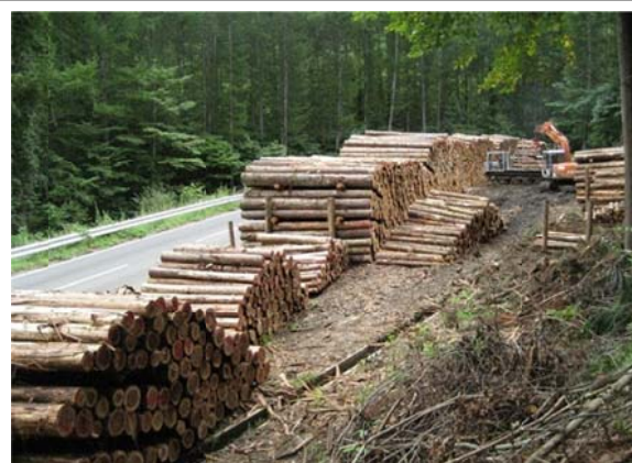
緑資源幹線林道八戸・川内線 林道沿いの土場施設を利用した木材搬出状況