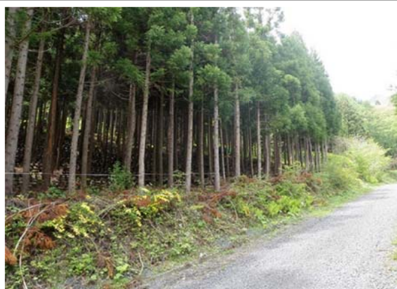
岩泉町内での原木しいたけ生産状況