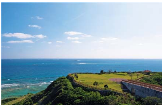
知念岬公園の風景