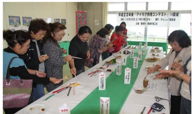
特産品を使った「アイデア料理コンテスト」