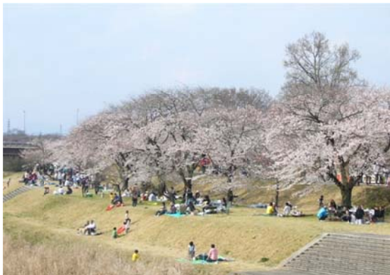
黒川の河川敷で花見を楽しむ人たち (しののめ花まつり)