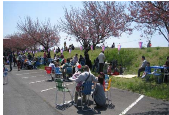
たくさんの人出でにぎわう はにしの里花まつり