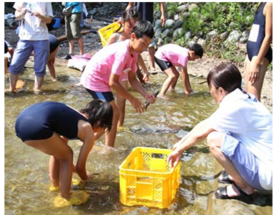
上下流交流事業（魚のつかみどり）