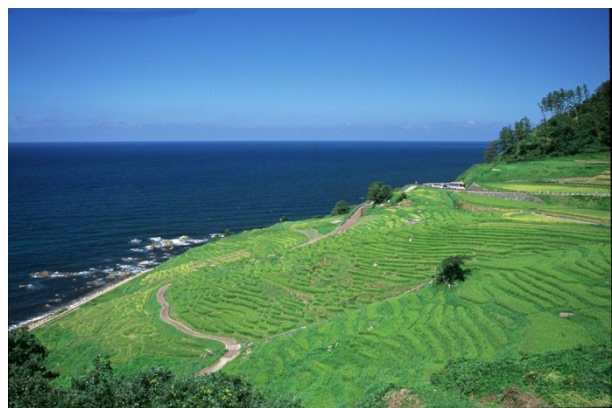
輪島市を代表する景勝地である千枚田