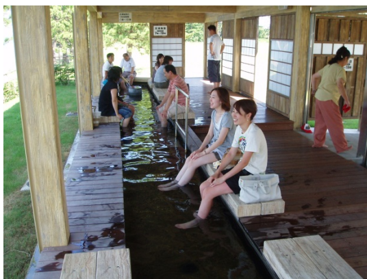
開湯 1200 年の歴史を誇る和倉温泉