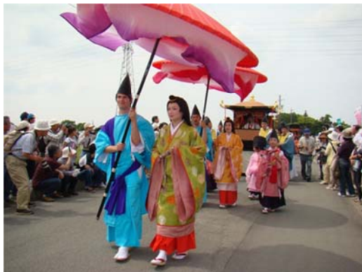
斎王まつり（歴史・文化と伝統の継承）