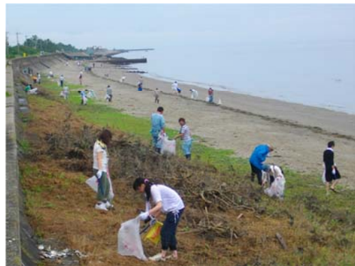
環境保全（環境美化活動）