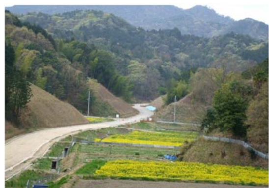
農産物の流通を支える農道