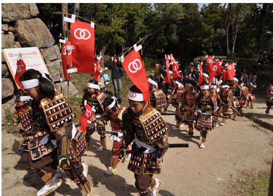
三熊山（洲本城 400 年祭）