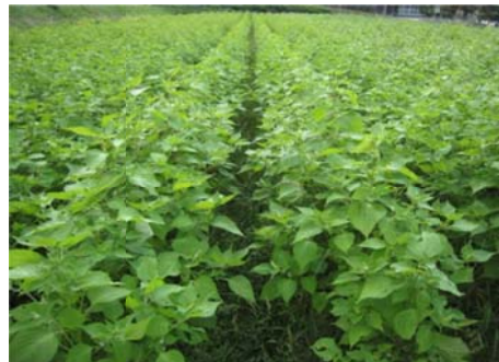
川本町で栽培されている「エゴマ」