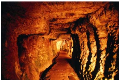
世界遺産 石見銀山の「龍源寺間歩」