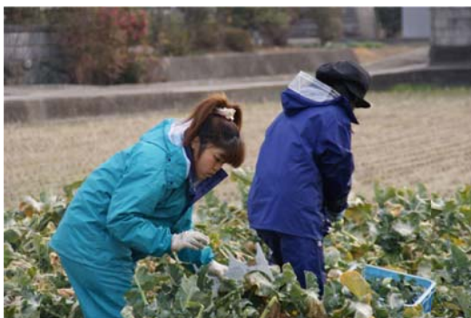
市場性の高い農産物の生産技術の習得 (ブロッコリーの収穫)