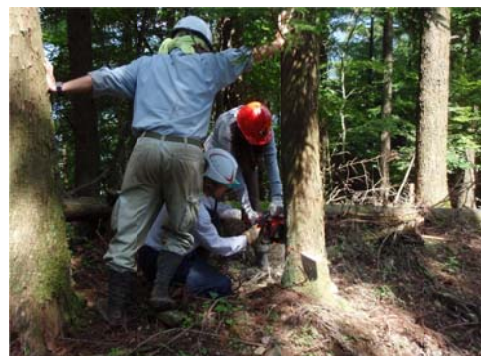
林業技術の習得 (チェーンソー取扱講習)