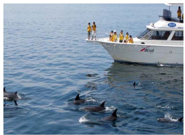
イルカウォッチング