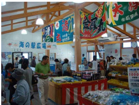
市物産館さんぱーる