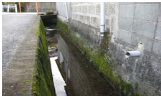
家庭雑排水の流入を無くし、きれいな水流へ