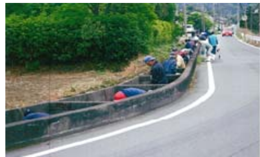
集落の中の用排水路を地域住民で一斉清掃