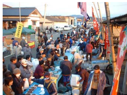
農・水産物市場（もってけ市）