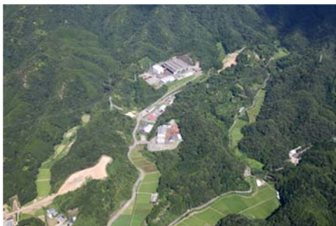
工業団地航空写真