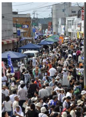
地場産品が並ぶトロントロン軽トラ市