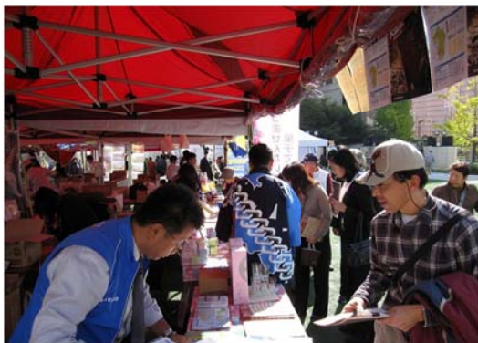
特産品の物販・販路開拓