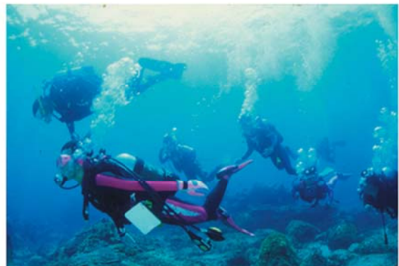
観光客受入（スキューバダイビング体験）