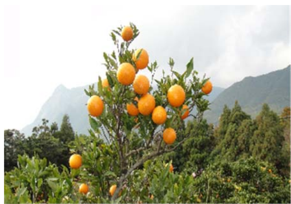
屋久島ブランド『タンカン』 (名称：おひさまのほっぺ)