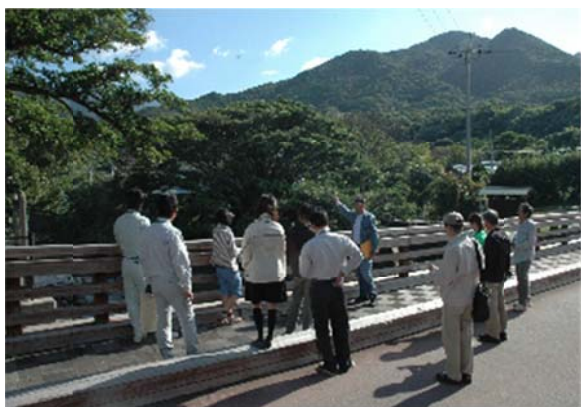
里の観光ツアーガイド