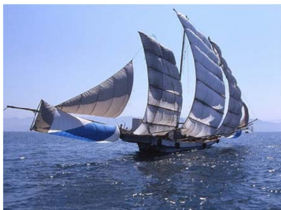
不知火海に浮かぶ「うたせ船」