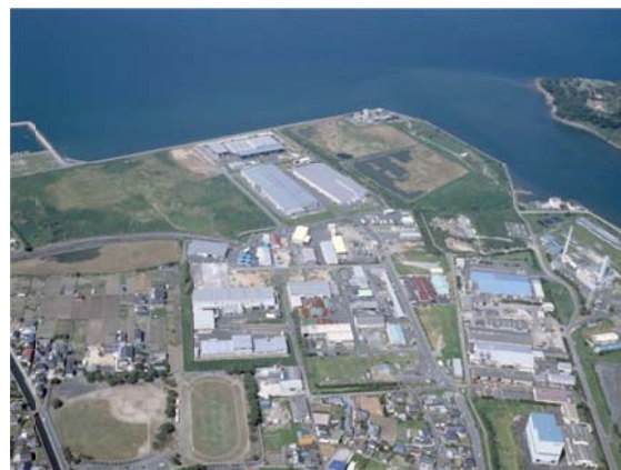
水俣エコタウン（水俣産業団地）