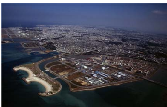
空港から15分『響（とよ）むまち とみぐすく』