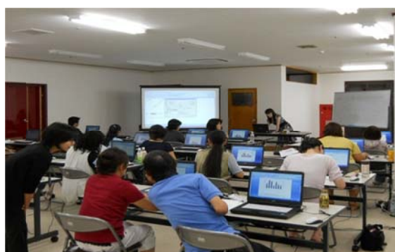
情報通信分野人材育成事業における セミナー風景