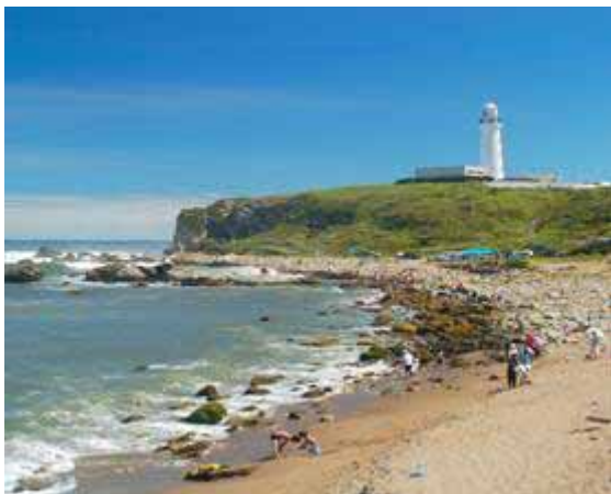
観光のシンボル犬吠埼灯台