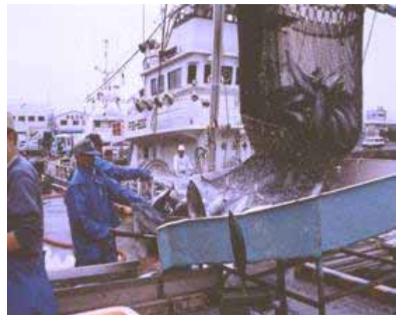
全国屈指の水揚げを誇る銚子漁港