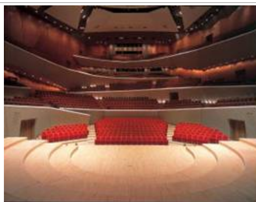
ミューザ川崎シンフォニーホール