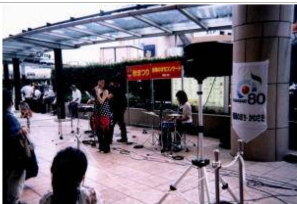
街角でのコンサート風景