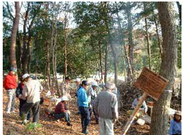
地域の財産である里山を保全する活動