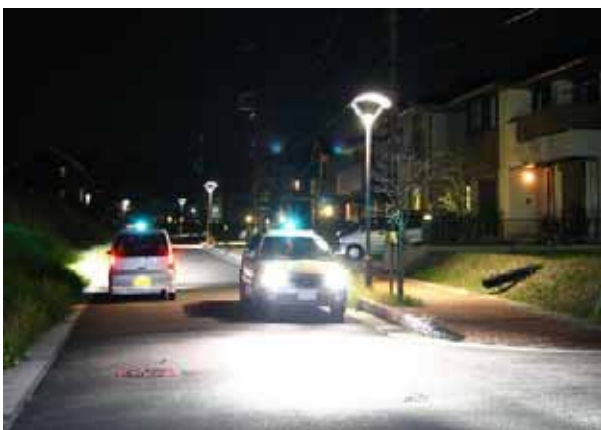
青色回転灯を使用した自主防犯パトロール