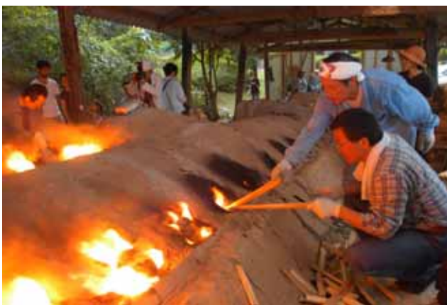
丹波焼登り窯 陶芸ワークショップ