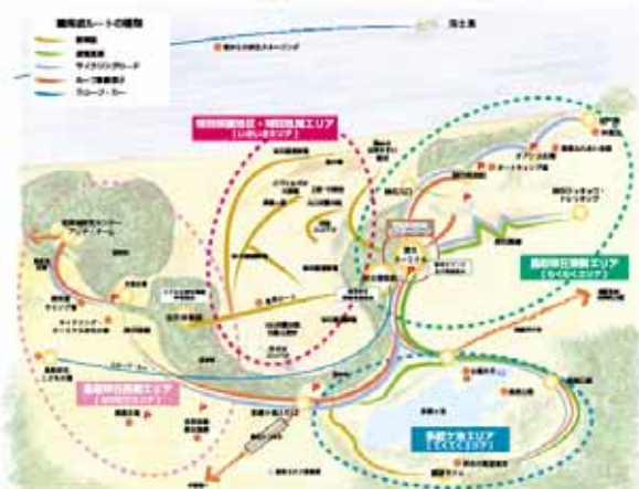
周遊型観光地としての鳥取砂丘の整備