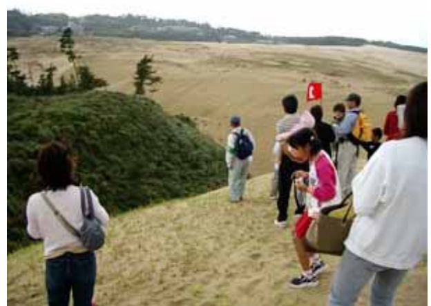
体験型観光における市民活動の活性化