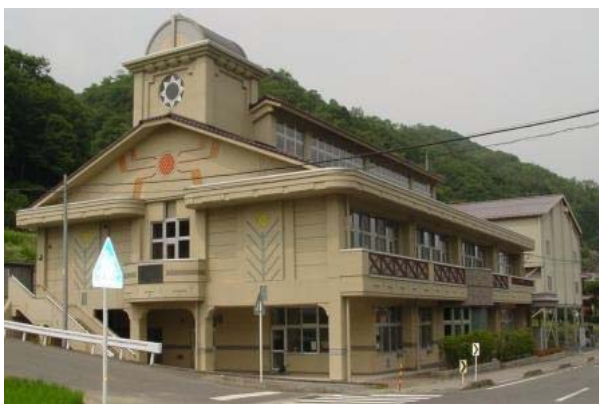
自治交流センター外観 (元小学校)