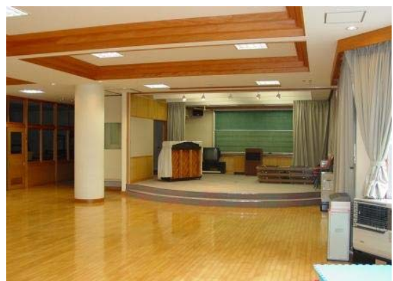
自治交流センター1階 (多目的ホール)