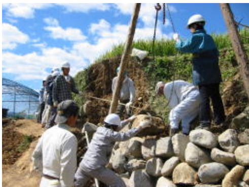
都市住民による棚田の石垣修復