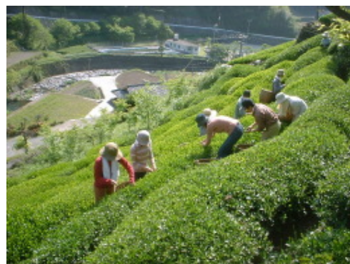
都市住民による農業体験（お茶つみ）