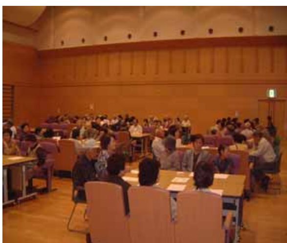
住民とのワークショップ