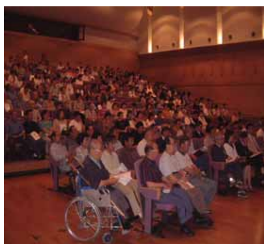
大学等による福祉講演会