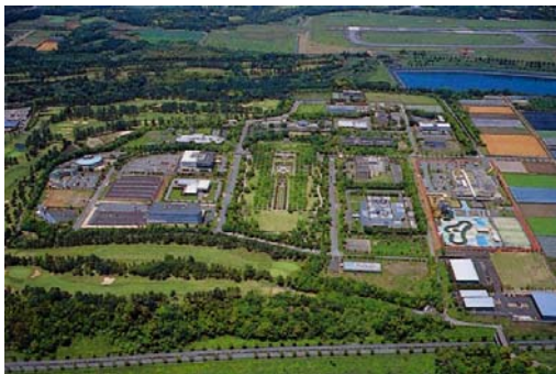
熊本テクノリサーチパーク