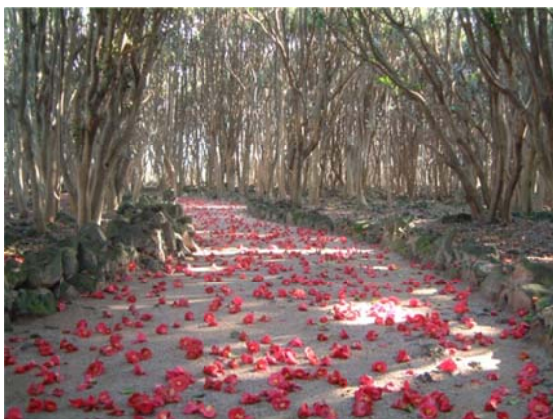
萩市笠山には約 25,000 本の椿林が広がる