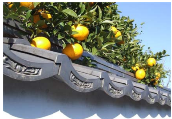
明治初年から萩の特産品となっている夏みかん