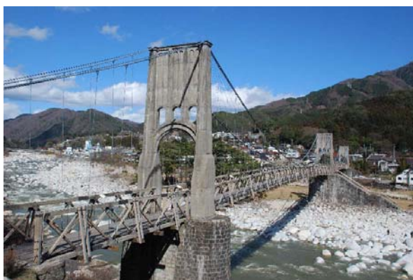
近代化遺産 天白公園「桃介橋」