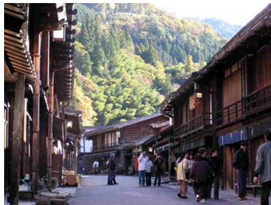
重要伝統的建造物群「妻籠宿」