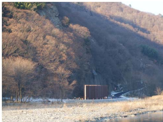
崖地と千曲川河川区域内の狭間を 通過している仮設道路