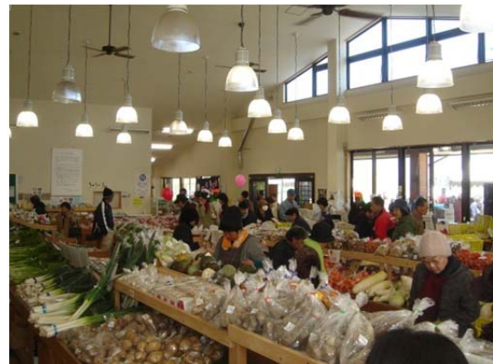
地域間交流と地産地消を促進する 農産物直売所