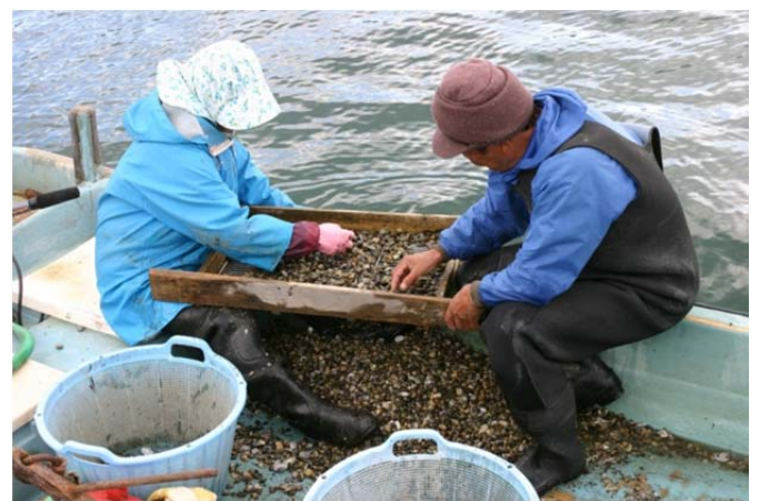
アサリの収穫風景