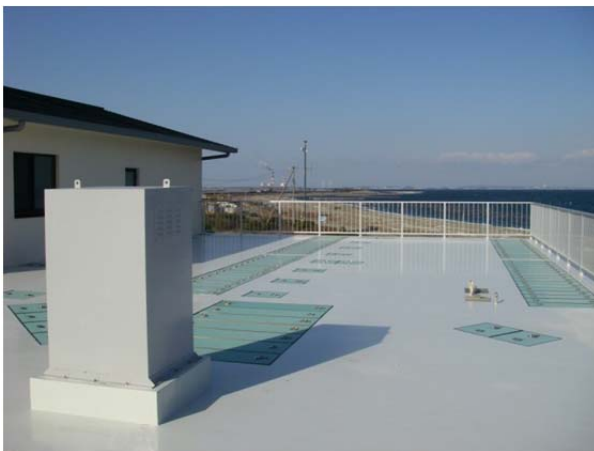
整備中の泉北部地区処理場から見た福江湾