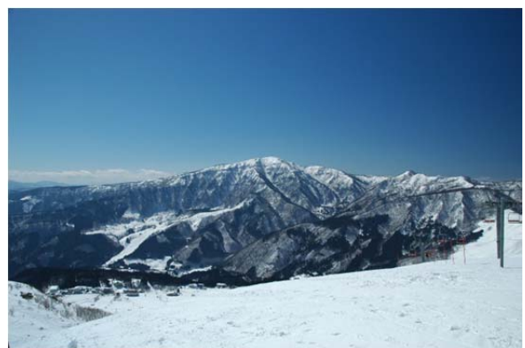
ハチ高原スキー場から望む氷ノ山 (県下最高峰)