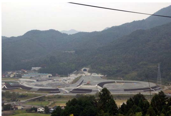
開通間近の北近畿豊岡自動車道 (八鹿氷ノ山 IC)