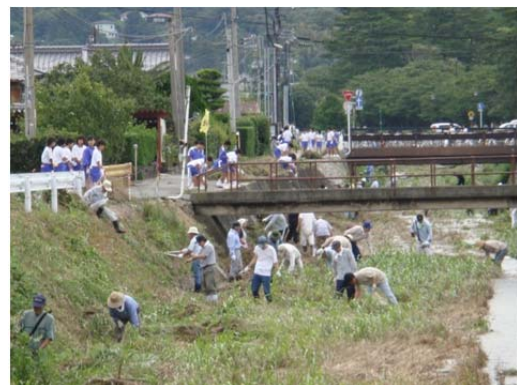
市民総参加による「河川海岸一斉清掃」