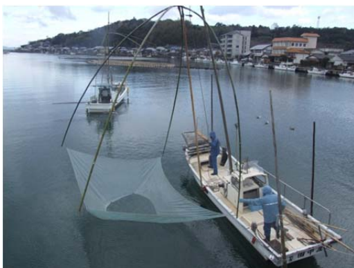
松本川河口での風物詩 四手網による「シロウオ漁」