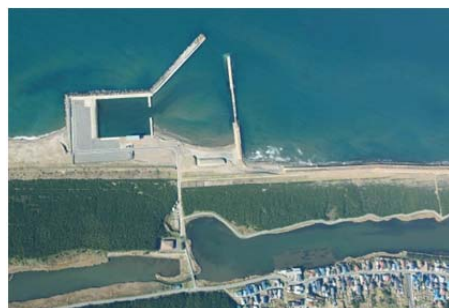
海面漁業の拠点として整備する十三漁港