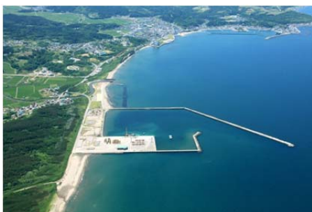
物流拠点として整備する七里長浜港