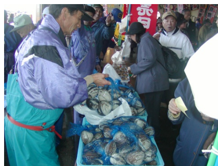
全国屈指の漁獲量を誇る 冬の味覚 ほっき貝