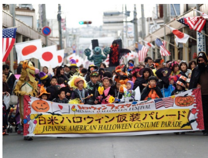
米国人も多数参加する 国際色豊かなイベント