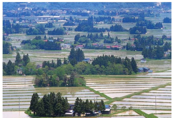
全国有数の散居集落と広大な田園