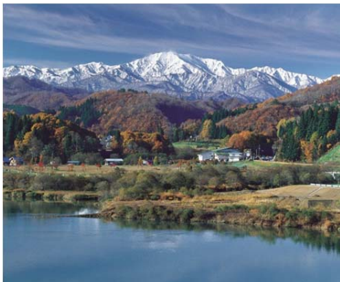
飯豊連峰から注ぎ入る白川ダム湖