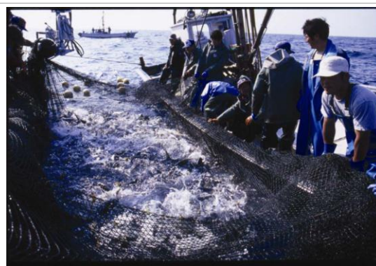
マダイ、ブリが跳ね踊る勇壮な大謀網漁