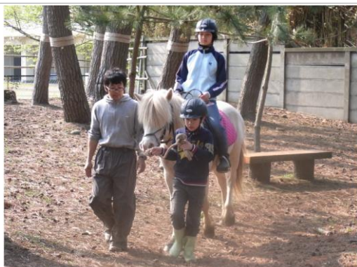
子供たちと馬のふれあい体験風景