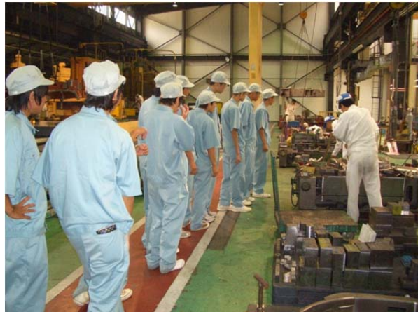
高校生ものづくり体験講座