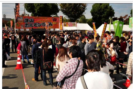
ご当地グルメを活用したおもてなし