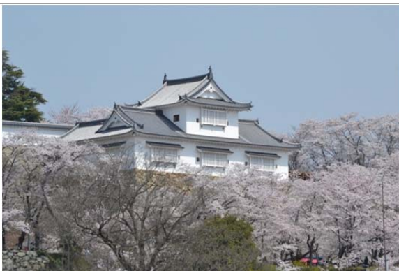
津山城跡「鶴山公園」