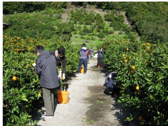
大学生によるミカン収穫ボランティア