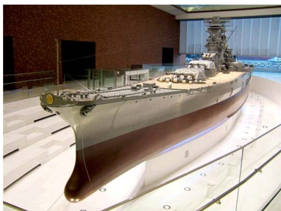
呉市海事歴史科学館の1/10 戦艦大和