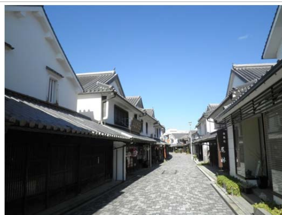
重要伝統的建造物群保存地区「白壁の町並み」