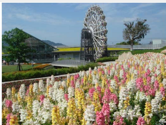
花と緑の庭園「やまぐちフラワーランド」