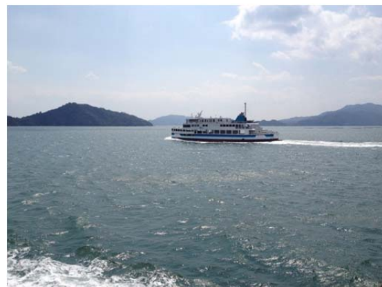
クルーズフェリーで巡る瀬戸内海