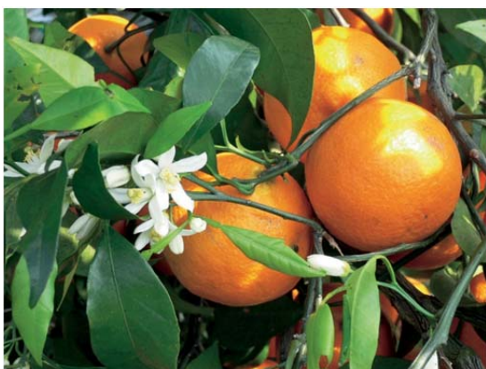
まつやま農林水産物ブランド ～カラマンダリン～