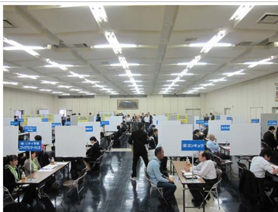
年2回開催している地域の合同就職面接会