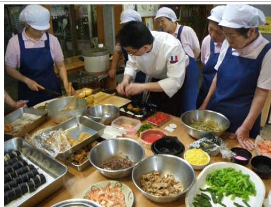
地元食材を使った道の駅のお弁当作り講習会