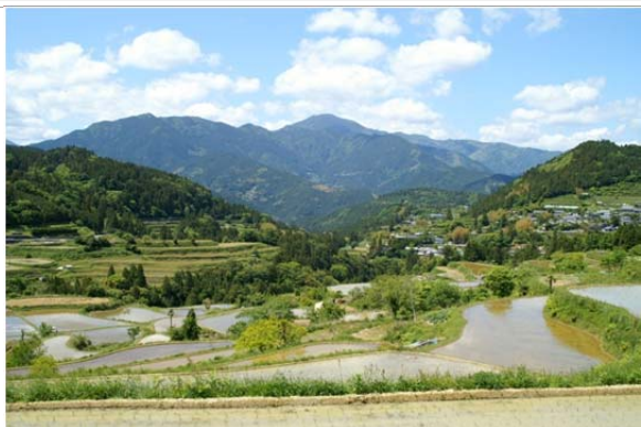
本山町の棚田風景