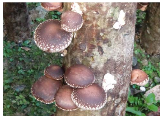
特産品の原木椎茸