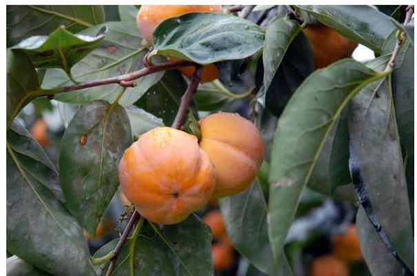
400年受け継がれる名産「川底柿」