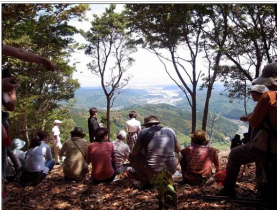
有田グリーンツーリズム研究会による体験活動