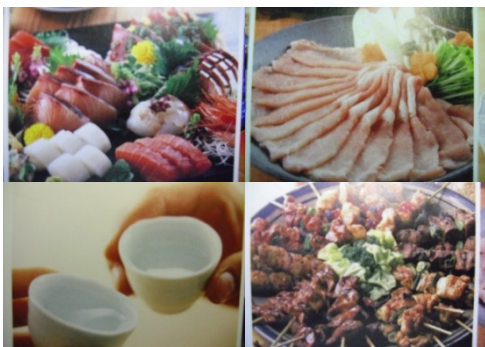
豊かな自然、広大な大地の食材 安心安全な食文化