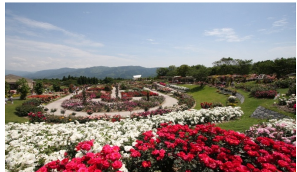
百万本のバラに抱かれ、癒される “かのやばら園”